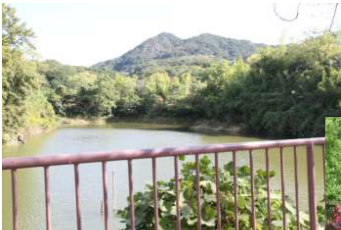
奥須磨公園から見える須磨アルプス