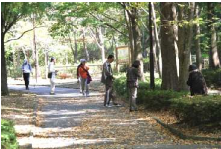
イチョウ、カツラが黄ばみ始めた公園