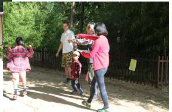
▼おじいちゃんと一緒に、うれしいな