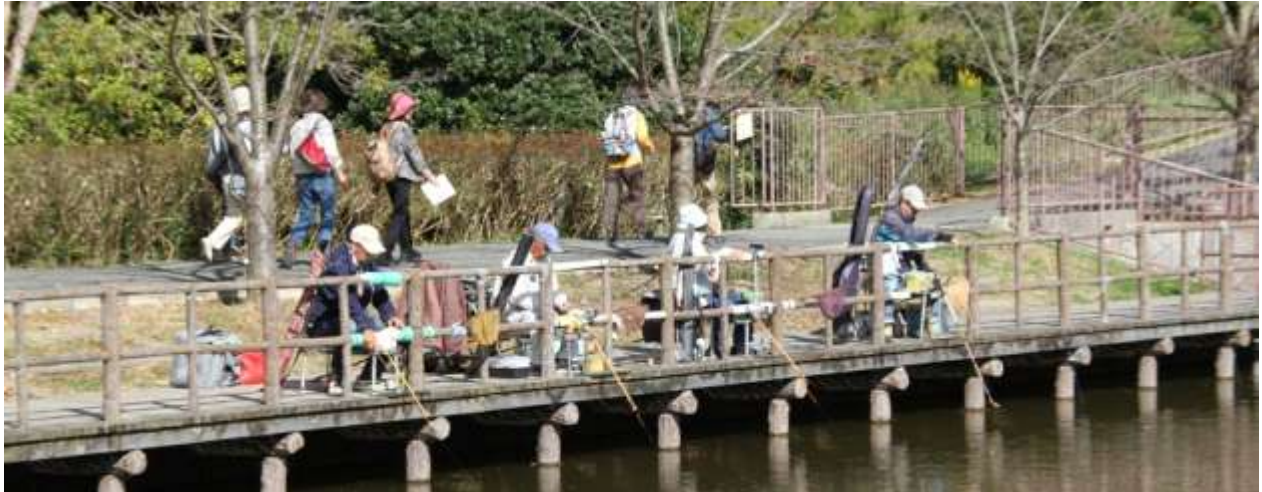
▲釣り人を横目に歩け、歩け